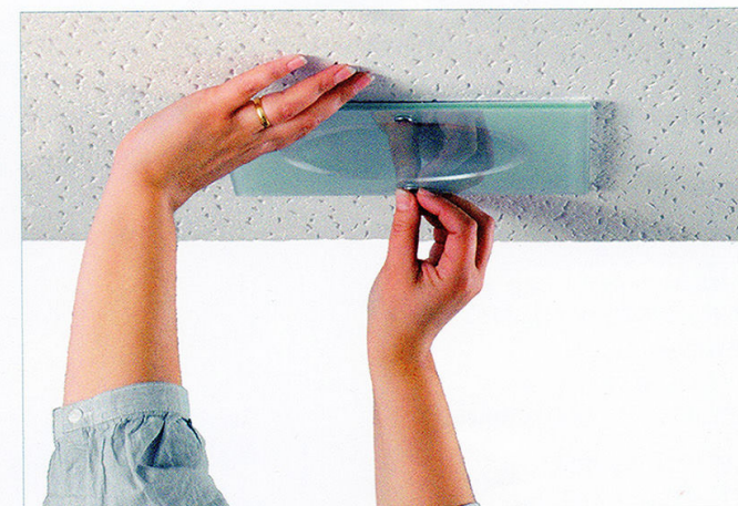
8 Volver a colocar el cristal