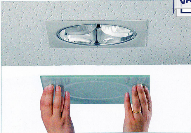
1 Retirar cristal