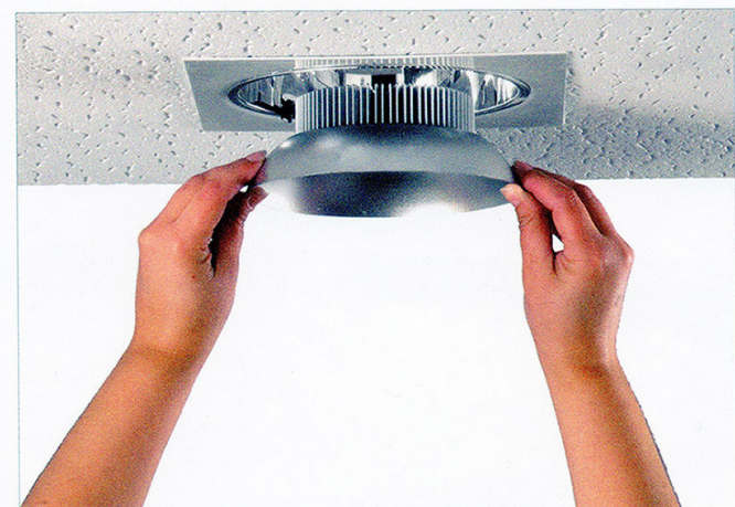
6. insertar en la carcasa del downlight.