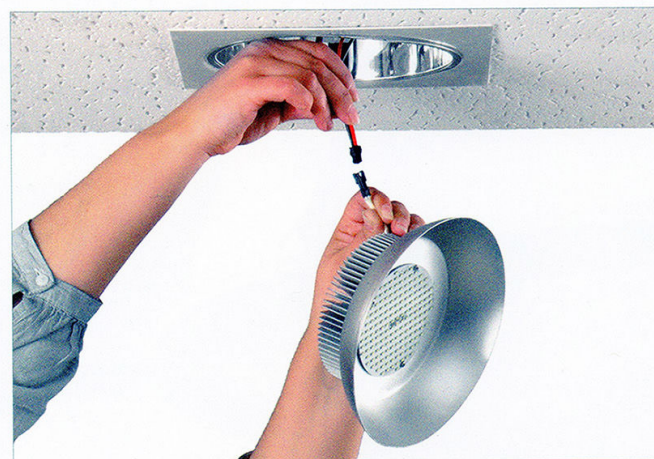
5: Conectar bombilla al equipo.