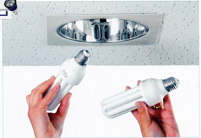
2. Quitar bombillas bajo consumo.